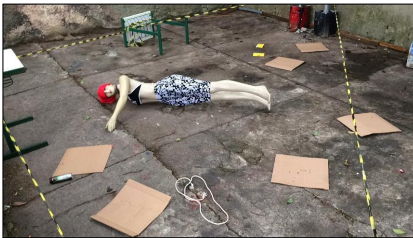
Figura 2 – Simulação de cena de crime montada para análise dos “alunos-peritos”.

Após a apresentação desses conteúdos, houve a inserção de uma situação-problema, cujo “aluno-perito” teria que resolvê-la. Para tal, montou-se uma simulação de cena de crime (Figura 2) com os vestígios necessários para a utilização dos conteúdos abordados e, assim, desvendar a problemática. A etapa seguinte constituiu-se de um debate entre os estudantes, divididos em pequenos grupos, visando analisar a resposta dada pelos alunos ao questionamento inicial: “a cena apresentada é um homicídio ou um suicídio?”, bem como analisar os conteúdos científicos evocados que embasassem suas conclusões. Por fim, os alunos responderam a um questionário aberto sobre os conceitos abordados na proposta em tela.